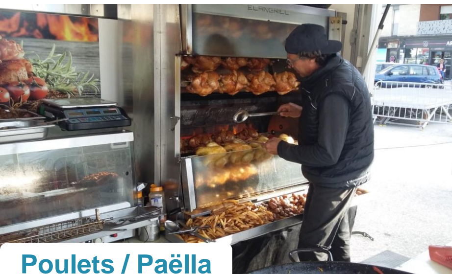
Poulets / Paëlla