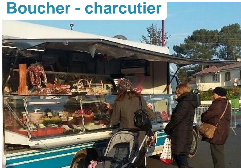
Boucher - charcutier