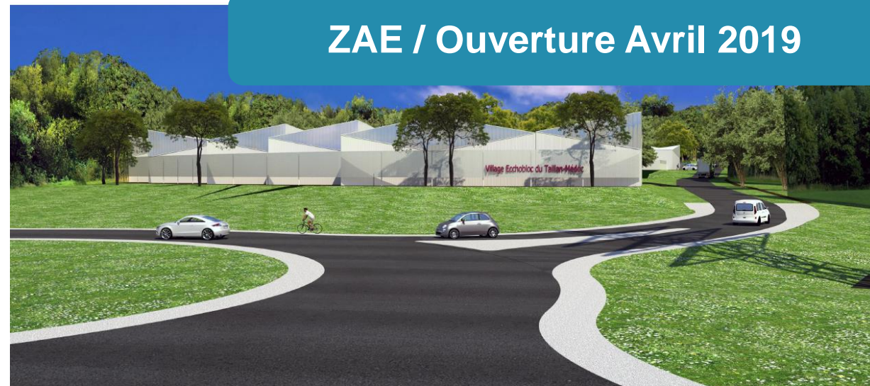
ZAE / Ouverture Avril 2019