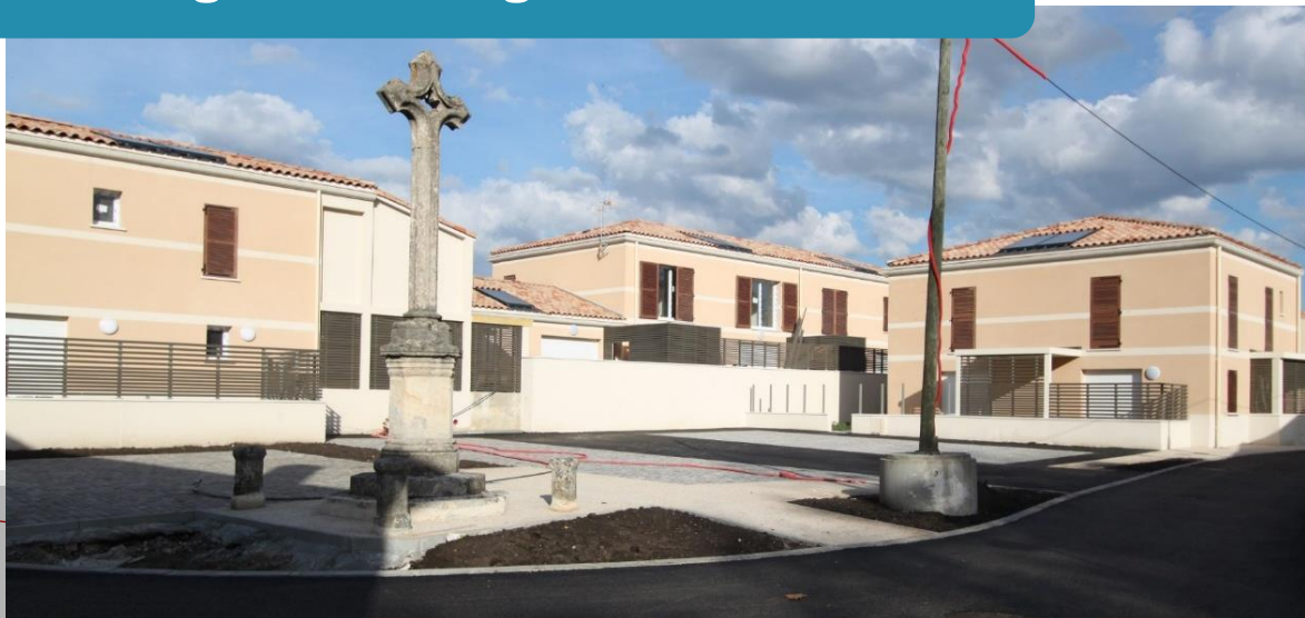
Bourg de Germignan / Dec. 2018