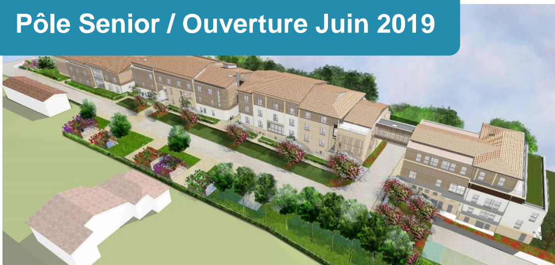
Pôle Senior / Ouverture Juin 2019