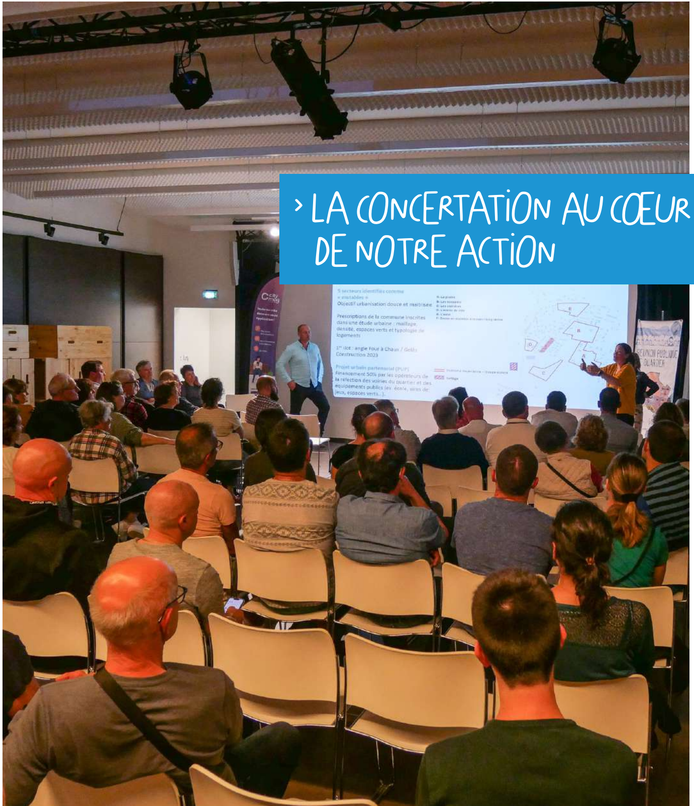
Réunion de quartier

> LA CONCERTATION AU CŒUR DE NOTRE ACTION