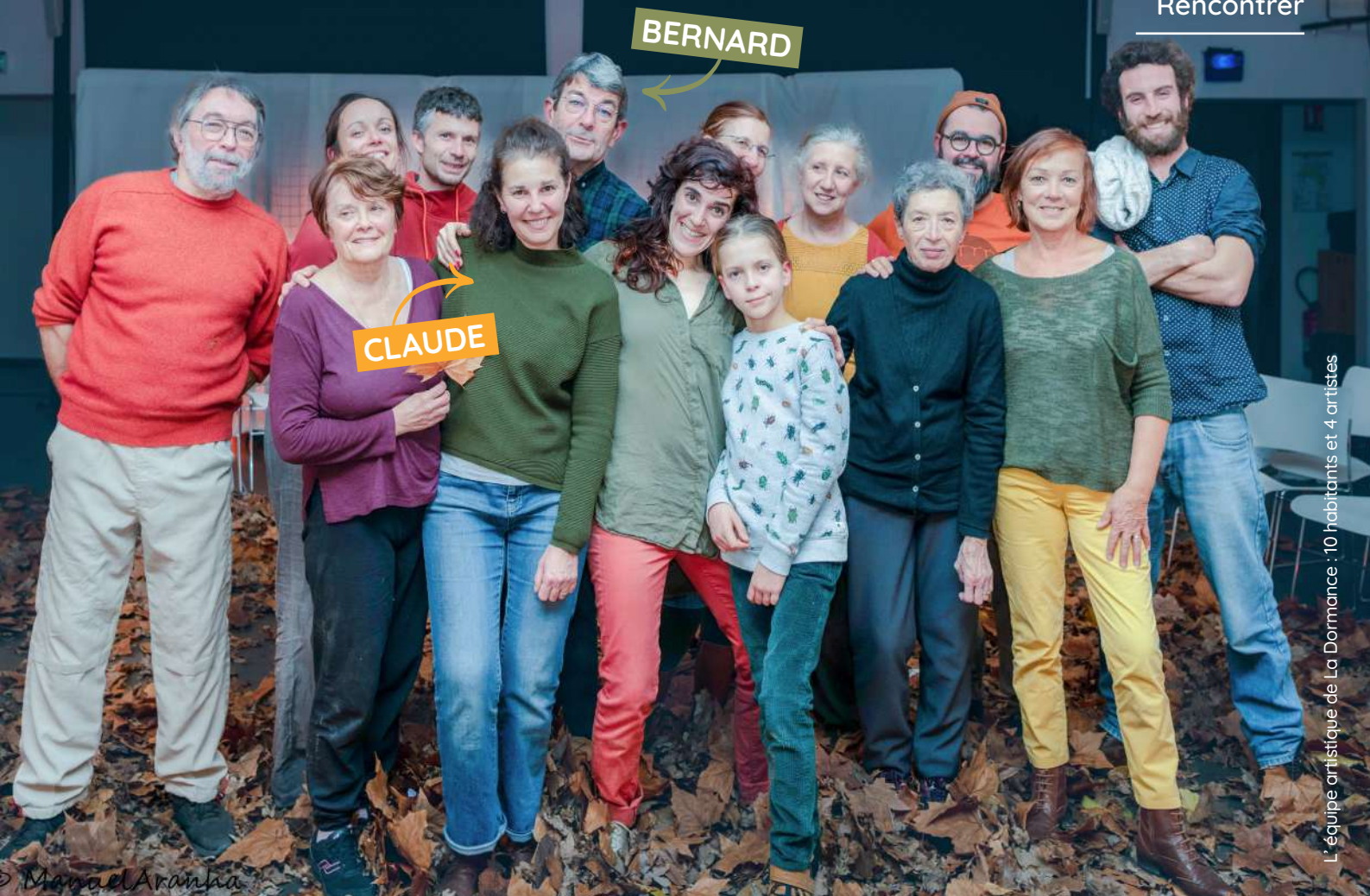
L'équipe artistique de La Dormance : 10 habitants et 4 artistes