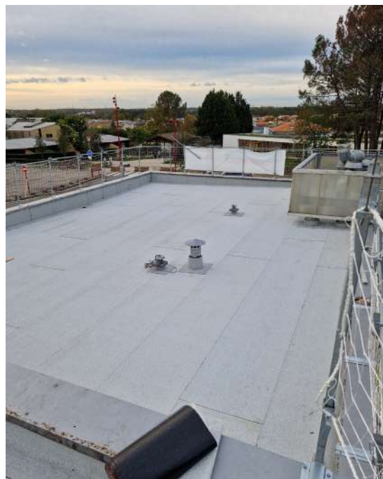
Toit de la Cabane

Par ailleurs, les situations sont disparates, avec soit des travaux classiques en attente de devis, mais aussi des démolitions (ancienne bibliothèque par exemple) et de gros travaux à chiffrer (sur le hangar à côté du cimetière ou pour la réparation de la toiture à Jean Pometan). Le coût de rénovation des bâtiments municipaux suite aux dégâts causés par la grêle est estimé à ce jour à 2 millions d'euros.