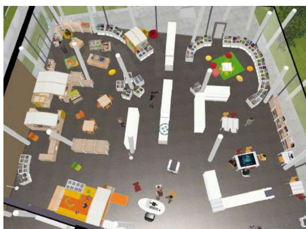
Projection des espaces

Nous avons essayé de créer une atmosphère de détente, conviviale, un peu comme à la maison avec des coins cabane pour se poser, lire ou jouer. Les jeux viennent se greffer aux livres, au sein des mêmes espaces. Pour les enfants, il y aura la possibilité de faire plein d'expériences. C'est un cadre que l'on a voulu propice aux échanges et qui reste modulable en fonction des retours que nous feront les Taillanais !