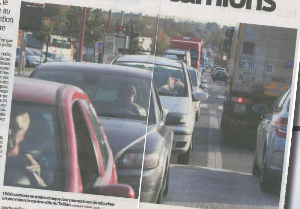
1 500 camions en moins chaque jour permettront de sécuriser un peu mieux le centre-ville du Taillan. (JOHANNES THIBAUD)

de passage ; les clients potentiels des commerçants qui n'ont aucune envie de s'enliser mais plutôt de fuir au plus vite ce goulot d'étranglement ; un niveau sonore