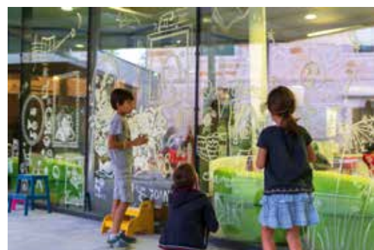
Nuit des bibliothèques