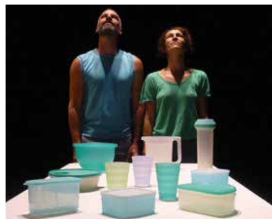
Moi je vous souhaite tous d'être heureux tous