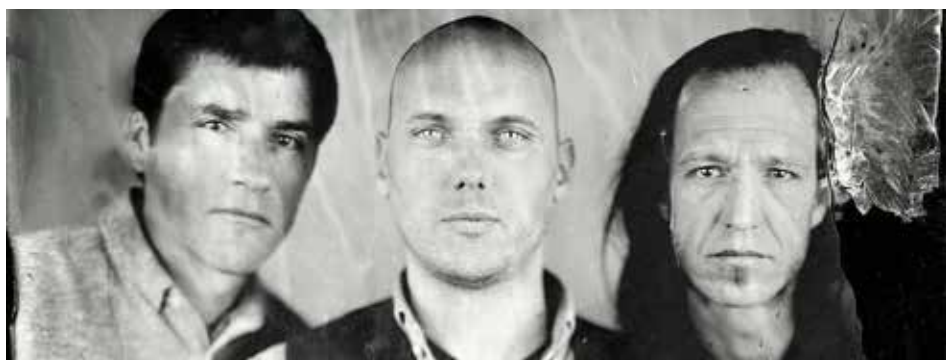
Blues is roots

Après le spectacle déambulatoire Le Chant des Pavillons les élus et les équipes du service Culture, de la médiathèque et de l'École Municipale de Musique vous présenteront les événements de la programmation culturelle qui se déroulera de septembre à juin. Ambiance conviviale et grignotage pour bien finir l'été !