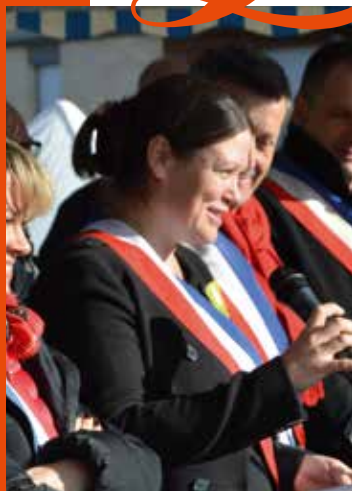
Agnès VERSEPUY Maire du Taillan-Médoc