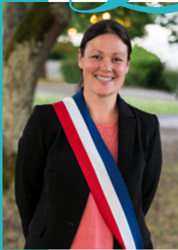
Agnès VERSEPUY Maire du Taillan-Médoc