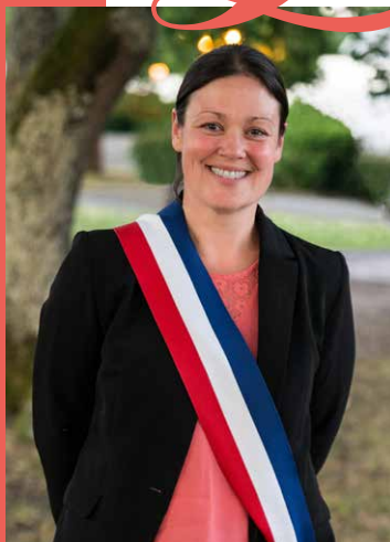
Agnès VERSEPUY Maire du Taillan-Médoc